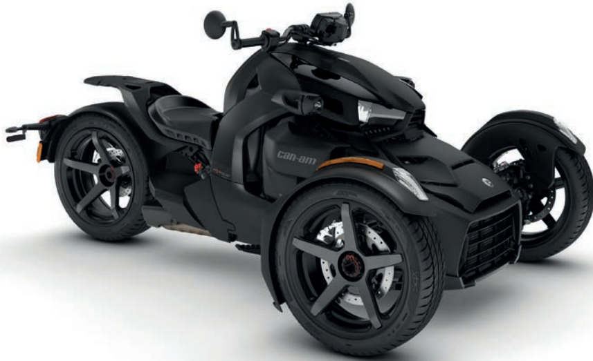
Rotax® 900 ACE™