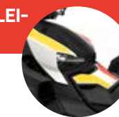
Heritage White IV